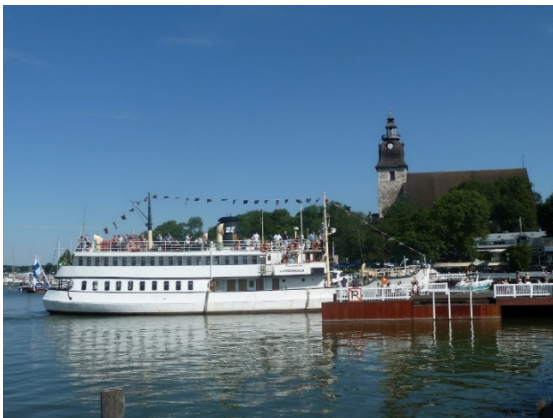
Kuva: Naantali ja Höyrylaiva Ukko-Pekka

Naantaliin tutustumisen jälkeen matka jatkuu kahden lossin yli Naantalin saarten rauhaan Velkualle, majoittuminen Saaristohotelli Vaihelassa . Se on ainutlaatuinen saaristomiljöö, jollaista ei löydy muualta. Korkeatasoinen hotelli, tunnelmallinen ravintola ja upeat saaristomaisemat takaavat ikimuistoisen loman. Vaihelan ravintola tarjoaa laadukkaita keittiön antimia. Viinikellarissa on mahdollisuus kokea keskiaikainen tunnelmaelämys holvikaarien alla.