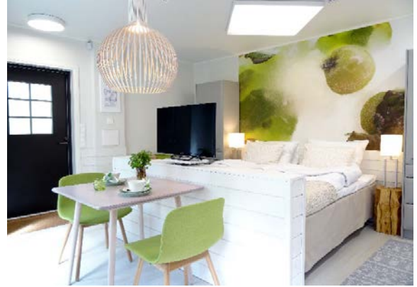
Kuva: Villa Hiidenmäki