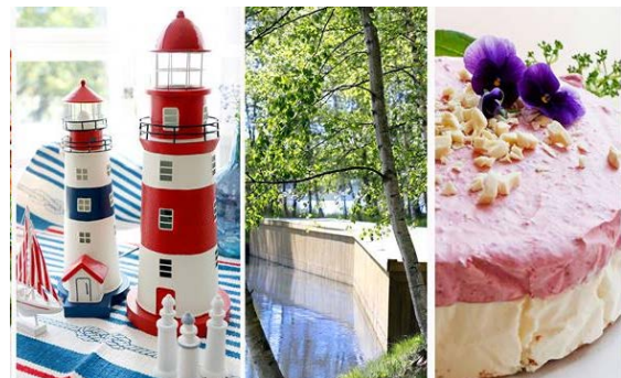
Kuva: Vartsalan Vanha Koulu