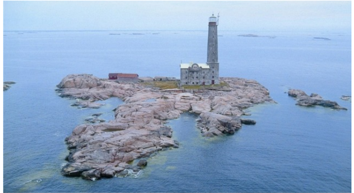
Kuva: Bengtskärin majakka